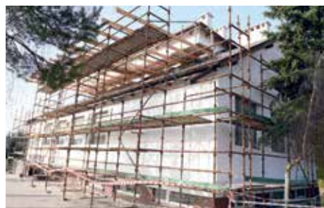
Gruntowna termomodernizacja szkoły w Osówce dzięki środkom KPO str. 3