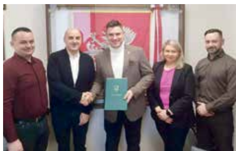
Rozbudujemy bazę lokalową gminnych jednostek OSP str. 3