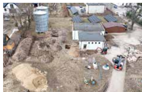
Modernizujemy Stację Uzdatniania Wody w Czernikowie str. 4