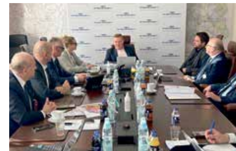
Ważny krok dla rozwoju przewozów pasażerskich na linii kolejowej Toruń – Czernikowo str. 4