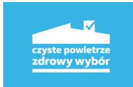
Czyste Powietrze - uwaga na oszustów! str. 6