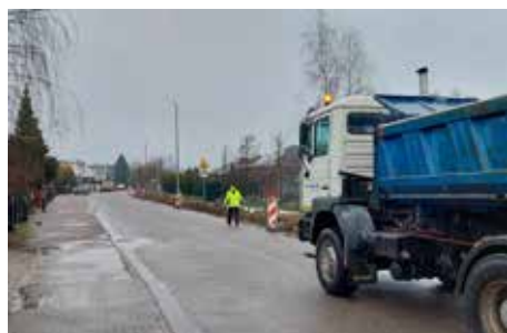
Na ulicach Reja i Góry wkrótce będzie bezpieczniej str. 3