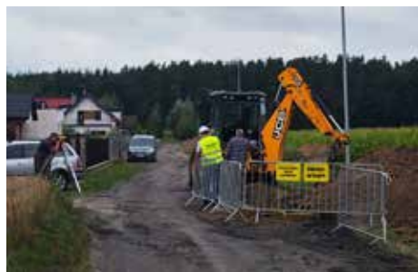
Inwestujemy w gospodarkę wodno-kanalizacyjną str. 7