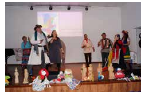
O Obyczajach Dobrzyńskich w Czernikowie str. 8