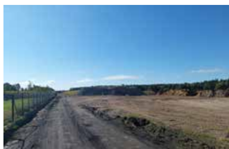
Rozbudujemy drogi w Makowiskach i Kielpinach str. 5