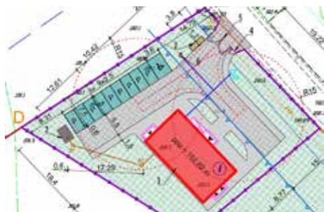
Świetlica w Makowiskach coraz bliżej str. 5