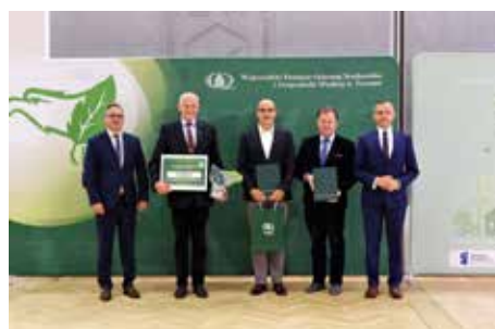
Gmina Czernikowo Liderem Czystego Powietrza str. 6