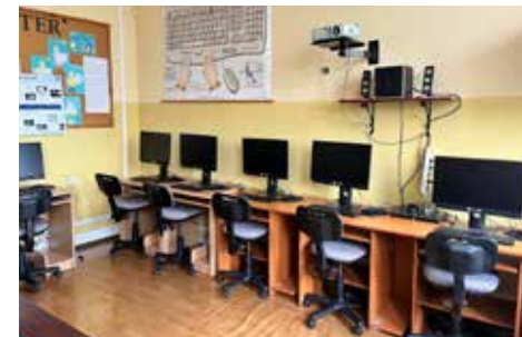
Szkoły podstawowe z komputerami do pracowni informatycznych str. 6