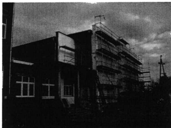
Na zdjęciu ocieplanie hali sportowej

W dalszym ciągu trwają prace przy budowie hali sportowej przy Zespole Szkół w Czernikowie. W chwili obecnej podłoga jest już założona i pomalowane są linie. W trosce o zdrowie uczniów oraz innych osób, które będą z niej korzystać, władze gminy podjęły decyzję o założeniu nowoczesnej nawierzchni sportowej z paneli drewnianych firmy Tarkett na elastycznym stelażu drewnianym. Najważniejszą cechą tego rodzaju podłogi jest to, że dzięki amortyzacji zmniejsza ona ryzyko kontuzji w trakcie ćwiczeń oraz gier zespołowych. W projekcie zaplanowano położenie wykładziny sportowej na