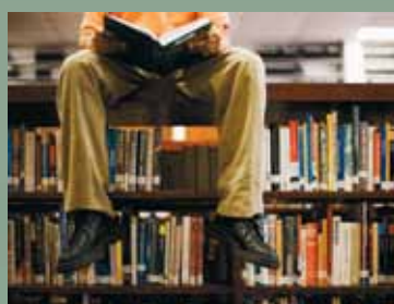
Wyprawka szkolna 2012 str. 7