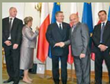
Samorządowcy u Prezydenta str. 3