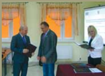
Uroczyste podpisanie umów w ramach PROW str. 2