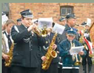
Uroczyste obchody Dnia Strażaka str. 5