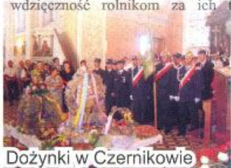
Dożynki w Czernikowie

Reaktywowana 3 lata temu na terenie naszej gminy tradycja organizacji dożynek spotyka się z coraz większym zainteresowaniem. Dowodem na to, poza dożynkami w Czernikowie, jest także zorganizowanie dożynek parafii Sumin w Makowiskach. Również w ich trakcie na ręce Wójta Gminy został złożony chleb dożynkowy oraz wieńce, a ich uczestnicy mieli okazję skorzystania z wielu specjalnie przygotowanych dla nich atrakcji.