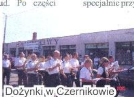
Dożynki w Czernikowie