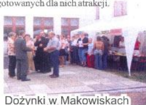
Dożynki w Makowiskach