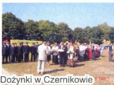
Dożynki w Czernikowie