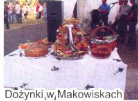
Dożynki w Makowiskach