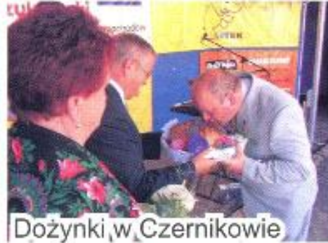
Dożynki w Czernikowie