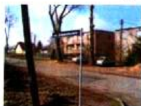
"efekty pracy" naszych wandalii